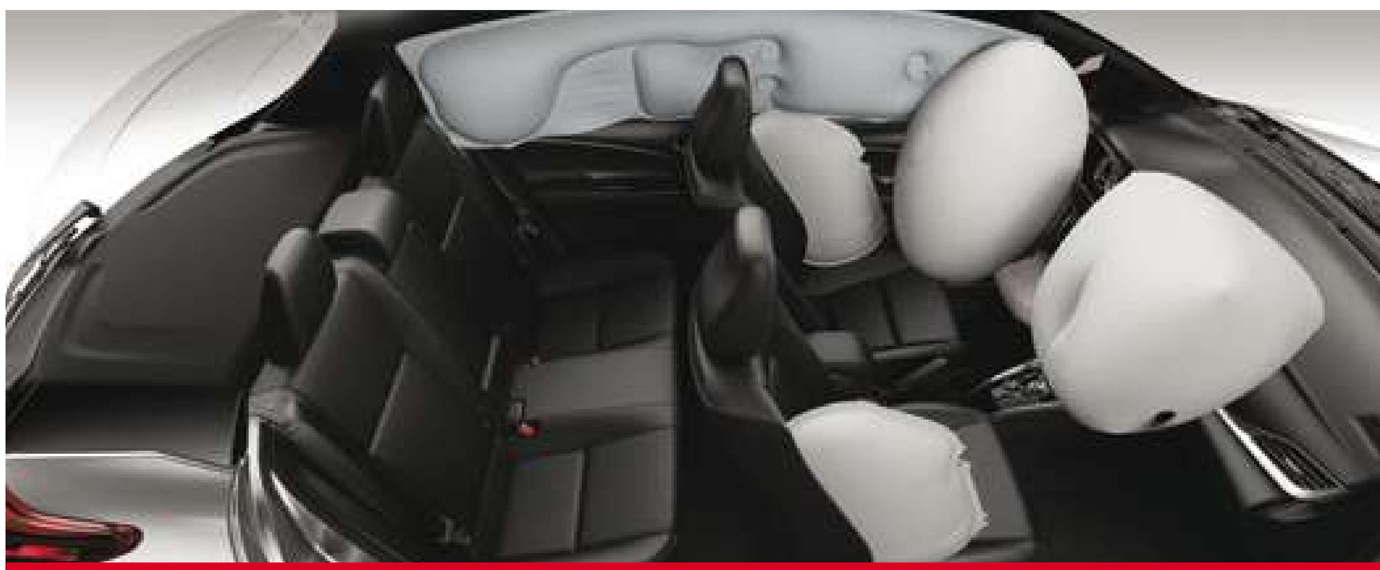
Airbags frontales, laterales, de cortina y de rodilla. (1)