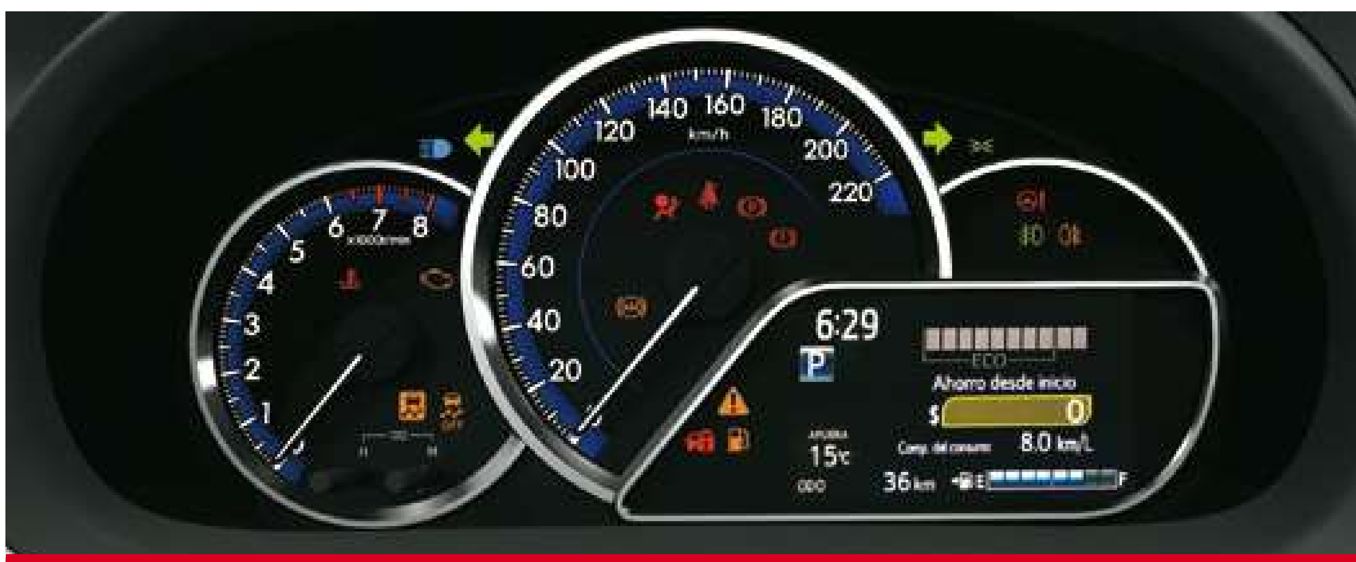
Display de información múltiple de 4,2". (2)