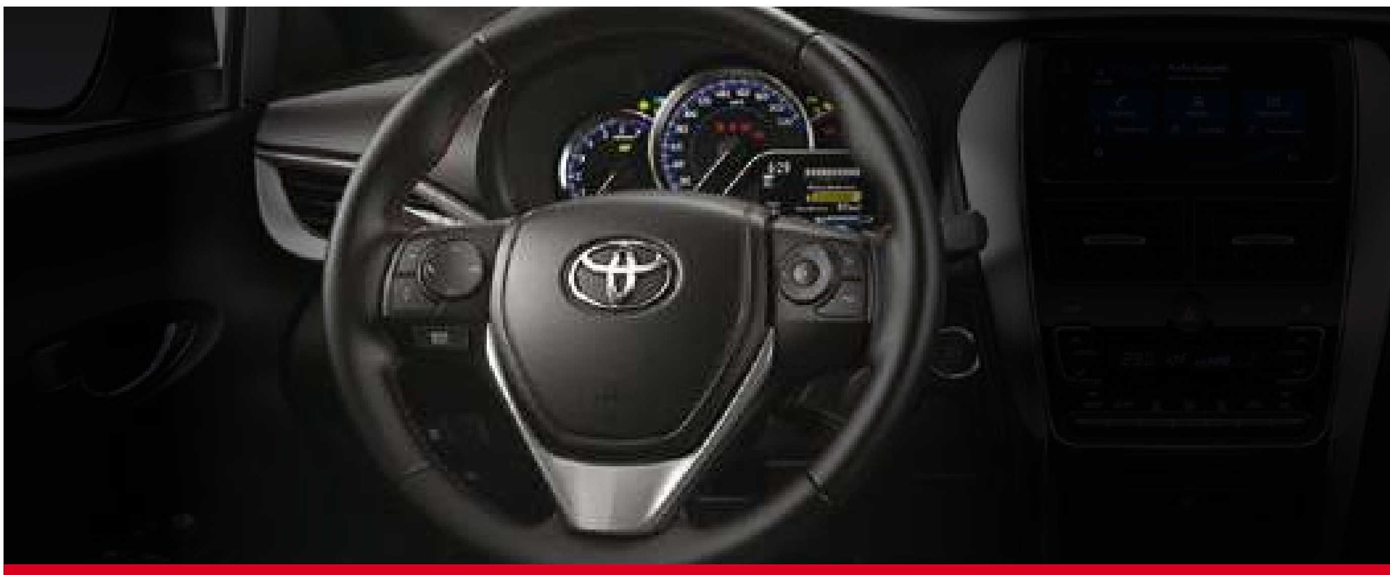
Volante multifunción. (1)